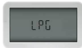
Fig 3. Tipo di gas (Es. LPG)

Prima di completare l'installazione, verificare le informazioni del contatore attivando il contatore (premendo il pulsante "A" per 3 secondi, navigare attraverso le ventisette (27) schermate toccando il pulsante "A". Assicurarsi: