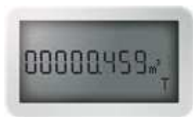
Fig 1. Totalizzatore (T)

Dopo aver effettuato la trasmissione forzata dell'“INVIO PUSH” verificare che essa risulta visibile sulla piattaforma Gestione Dati.