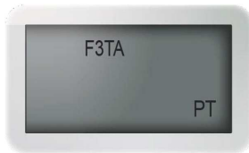
Fig 2. Invio Push (PT)